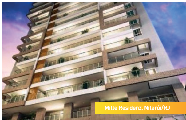
Mitte Residenz, Niterói/RJ