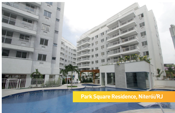
Park Square Residence, Niterói/RJ