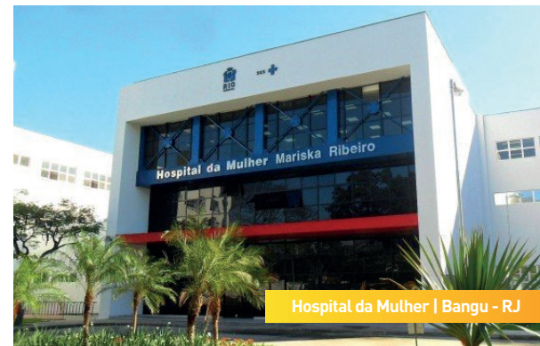
Hospital da Mulher | Bangu - RJ