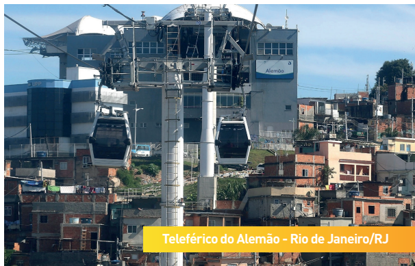
Teleférico do Alemão - Rio de Janeiro/RJ