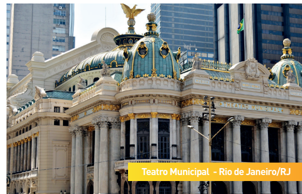
Teatro Municipal - Rio de Janeiro/RJ