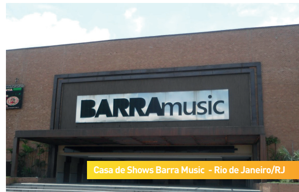
Casa de Shows Barra Music - Rio de Janeiro/RJ