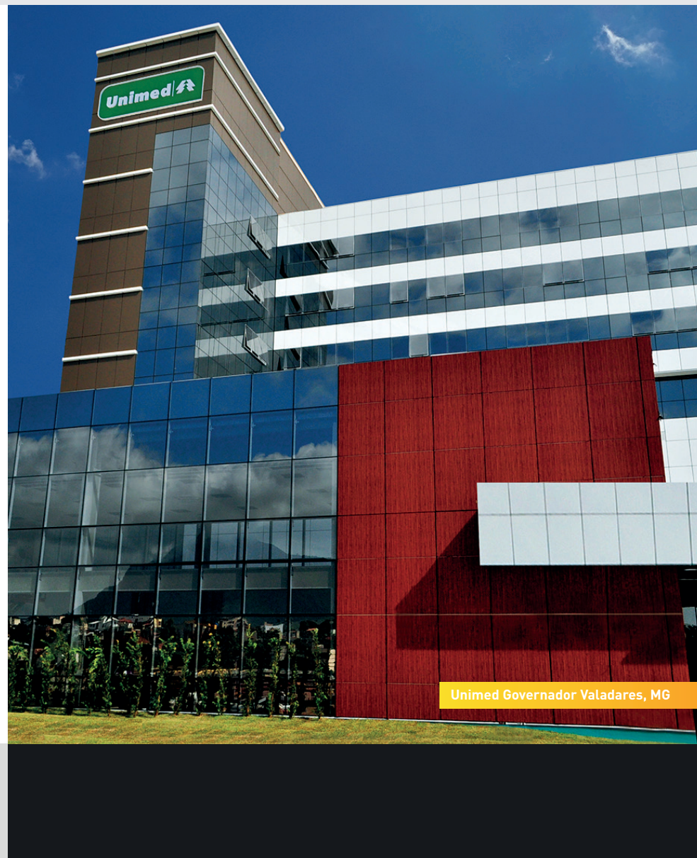
Unimed Governador Valadares, MG

O Hospital Unimed possui ainda auditório com capacidade para 120 pessoas, restaurante e estacionamento com 250 vagas. Mais um diferencial é o heliponto para garantir agilidade no atendimento ao paciente em situação grave que necessite ser transferido.