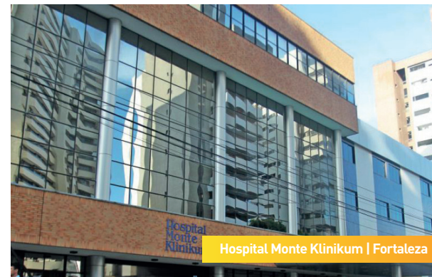
Hospital Monte Klinikum | Fortaleza