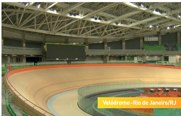
Velódromo - Rio de Janeiro/RJ