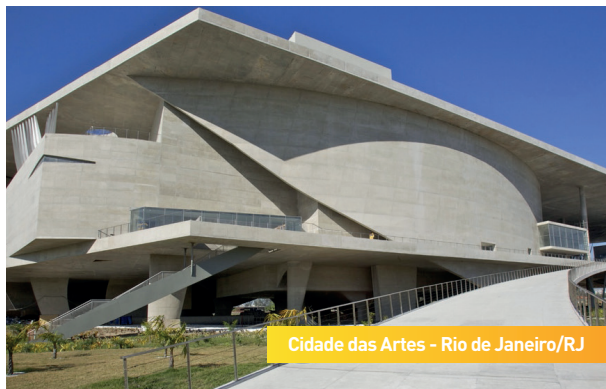
Cidade das Artes - Rio de Janeiro/RJ