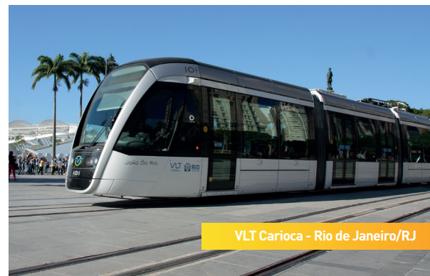
VLT Carioca - Rio de Janeiro/RJ