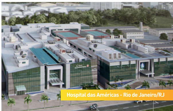
Hospital das Américas - Rio de Janeiro/RJ